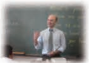
外国人講師による専門指導 (H26指定校) 大阪府立三原丘高等学校

グローバルな社会課題を発見・解決し、様々な国際舞台で活躍できる人材(国際機関職員、社会起業家、グローバル企業の経営者、政治家、研究者等)の輩出