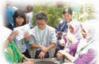
海外フィールドワークの様子 (H26指定校) 筑波大学附属豊原高等学校